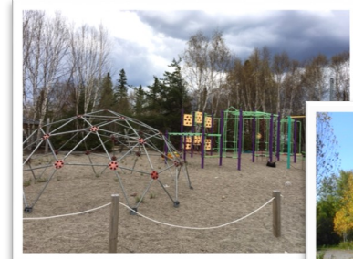
Parc Lac Parent